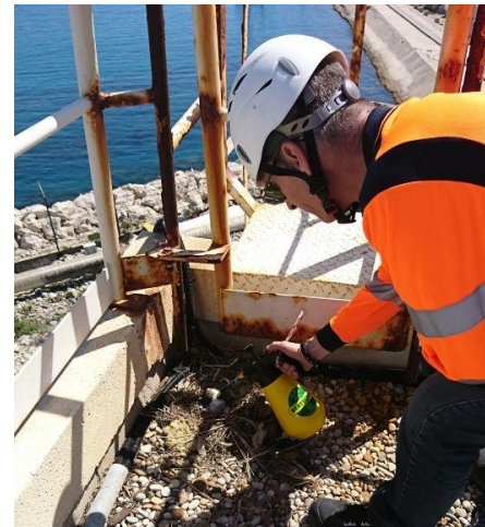
Pulvérisation du stérilisant sur les œufs

La stérilisation est l'une des méthodes que nous pratiquons parmi le panel des solutions de gestion de la nidification, mais il s'agit en aucun cas d'une réponse unique à la régulation des populations de Laridés.