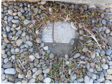
Autre ébauche de nid sur la toiture

Les ébauches sont des nids confectionnés qui ne contiennent pas encore d'œufs. Souvent consistants au début de la nidification, ils ont tendance à l'être beaucoup moins en cas de situation de stress pour les oiseaux qui les construiront à la hâte et de manière fébrile.