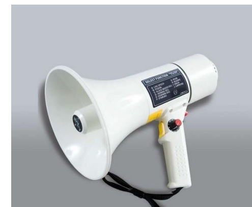
Mégaphone Effaroucheur avec cris de détresse