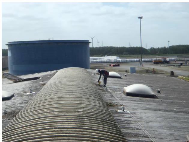
Exemple de stérilisation réalisée sur un autre site