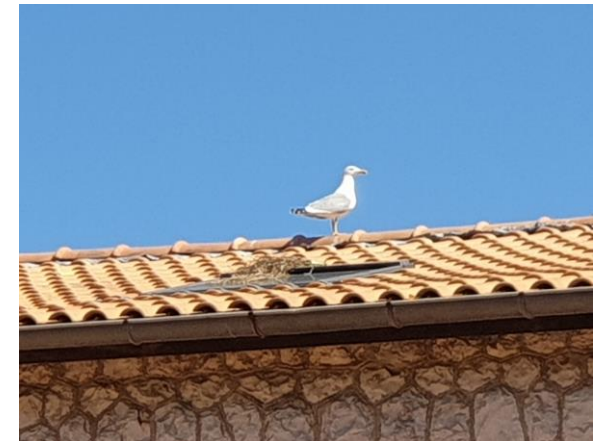
Nid sur un des vélux du Centre des Arts