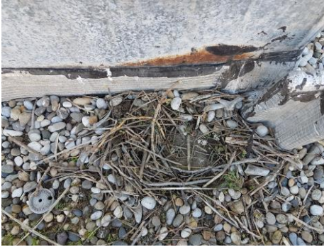
Ébauche de nid sur une toiture