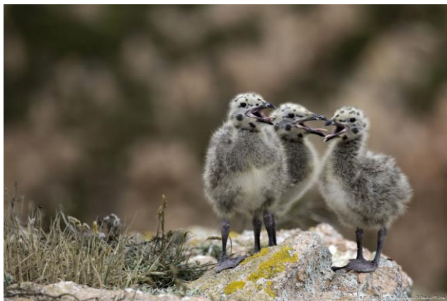
Oisillons Goélands Leucophée

L'Arrêté Préfectoral nous autorisant à effectuer une perturbation intentionnelle de la nidification des goélands leucophées nous a été notifié le 20 avril 2021. C'est pourquoi il nous a fallu mettre rapidement en place toute la stratégie de gestion de la nidification des goélands que nous avons prévue et l'adapter à son stade déjà bien avancé. En effet certains couples d'oiseaux de la commune avaient pondu aux environs de la fin du mois de mars et d'autres durant les dix premiers jours du mois d'avril.