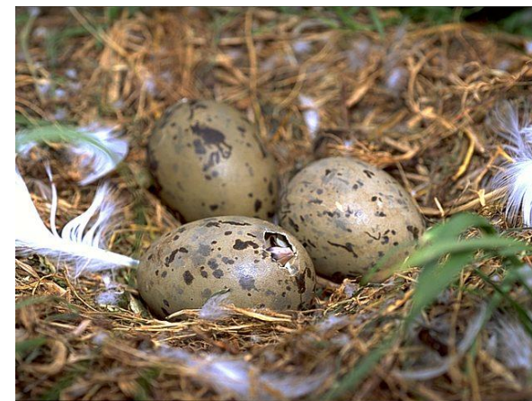
Nid de goélands et éclosion d'un oisillon

Le nombre de couples de goélands nicheurs évoqué dans l'analyse de nidification de la commune sont minimales mais raisonnables. 120 nids à traiter la première année sur la totalité de la ville en particulier si le secteur privé participe sous convention au plan d'actions 2022 et en cas de prolongation de l'arrêté préfectoral accordé cette année.