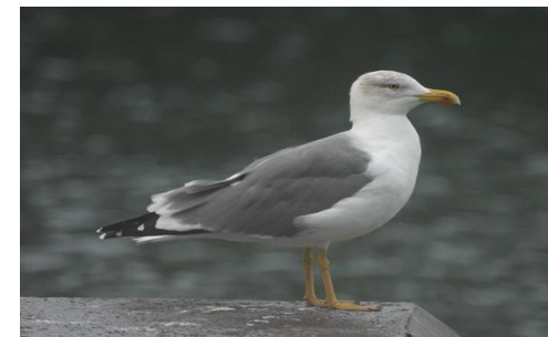
Goéland Leucophaée observant d'un angle de mur