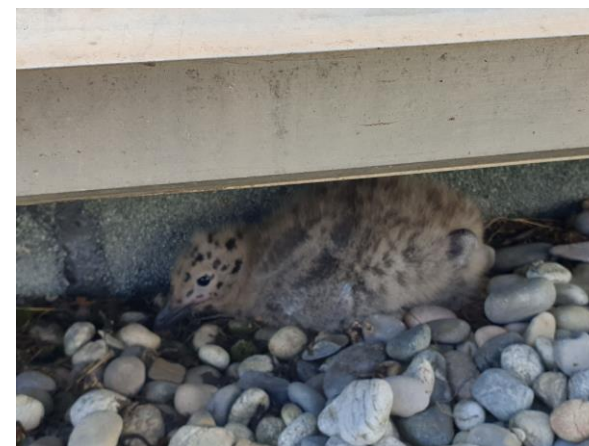
Jeune oisillon se cachant suite aux cris de ses parents