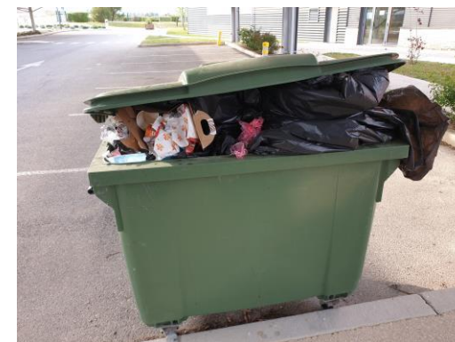
Benne ne fermant plus et débordante de déchets alimentaires pour les Goélands