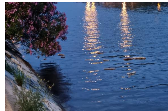
Jet de pains entiers dans le canal servant de repas aux poissons et Goélands