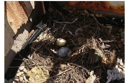
Œuf recouvert de stérilisant