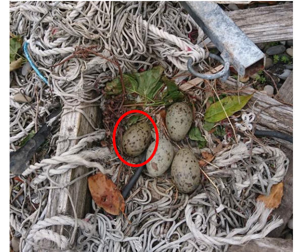
Exemple de nid avec un œuf ayant tourné

Cela nous démontre qu'ils ne craignent pas les humains et que ces derniers ne représentent pas un danger. Par ailleurs, durant la période où les oisillons deviennent autonomes, ils ne sont pas encore éduqués et ont un comportement hasardeux comme beaucoup d'oiseaux juvéniles. Il est donc important de leur montrer par des actions adaptées que l'humain présente un risque permanent pour eux.